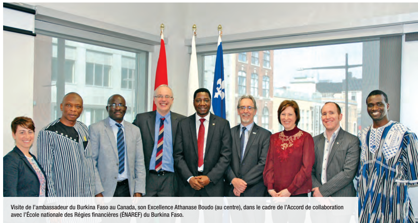
Visite de l'ambassadeur du Burkina Faso au Canada, son Excellence Athanase Boudo (au centre), dans le cadre de l'Accord de collaboration avec l'École nationale des Régies financières (ÉNAREF) du Burkina Faso.